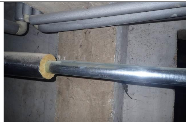
Rozvody ÚT – chybějící izolace