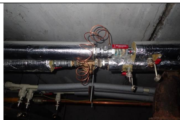
Rozvody ÚT a TV