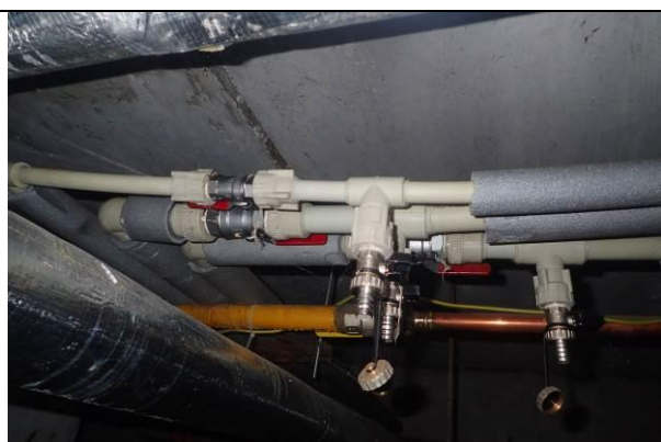
Rozvody TV– chybějící izolace