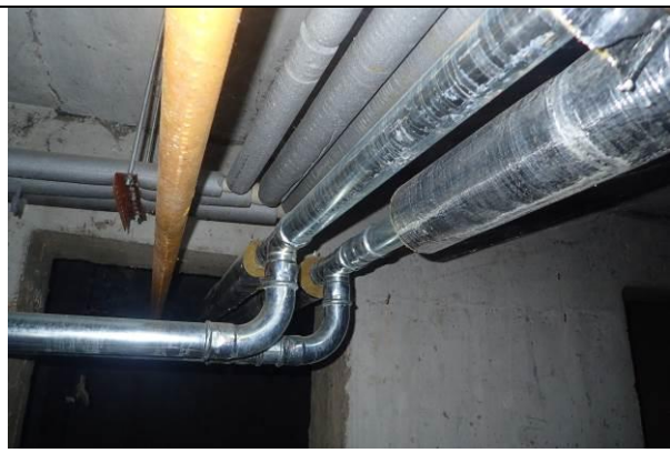
Rozvody ÚT – chybějící izolace