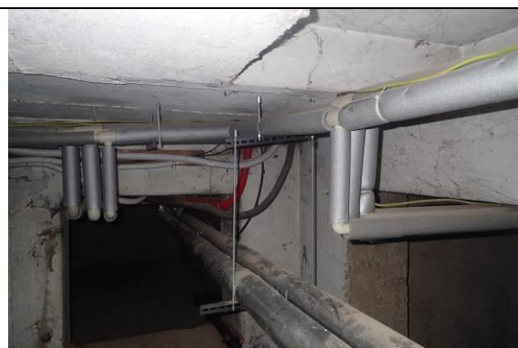
Rozvody TV a ÚT