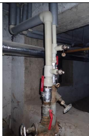
Rozvody TV - chybějící izolace